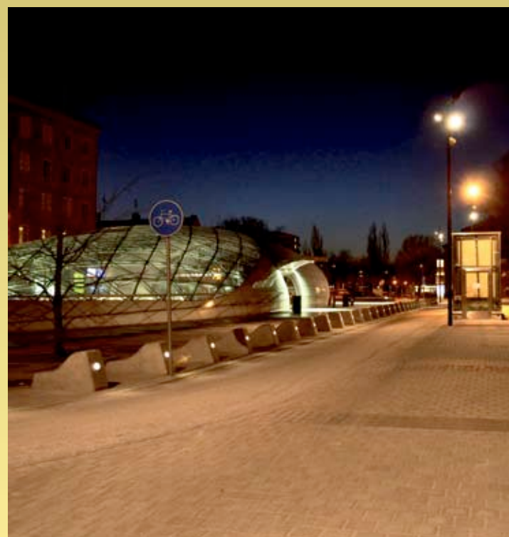
Station Triangeln, Malmö Armaturnightspot Ljusdesign/projekt Accendo Niklas Ekström, Malmö.