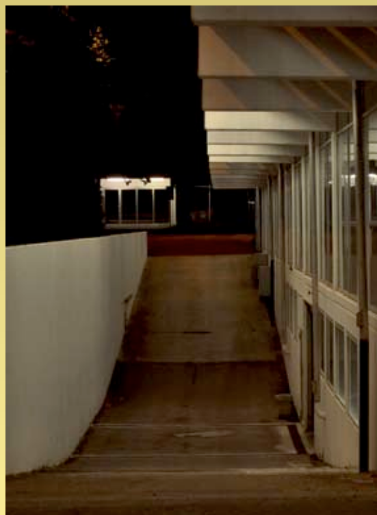
Baltiska hallen, Malmö Armaturnightspot Bern Ljusdesign/projekt Grontmij, Malmö.