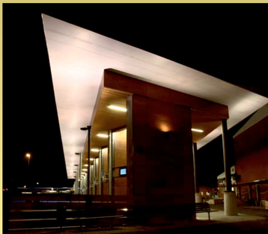
Landvetter resecentrum Armaturnightspot Sweco Arkitekter, Göteborg, Elkonsult Ramböll.