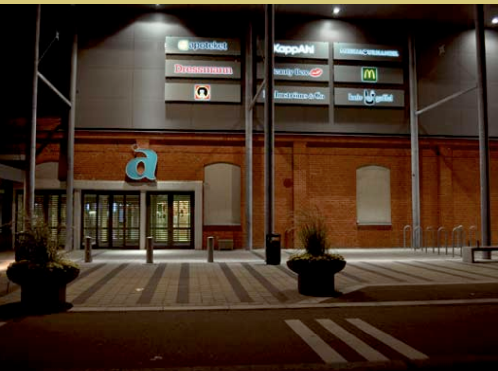
Mobilia köpcenter, Malmö Armaturnightspot Superlight Compact Ljusdesign Peter Nilsson, Node Ljusdesign AB, Stockholm.