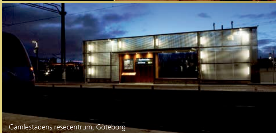
Gamlestadens resecentrum, Göteborg