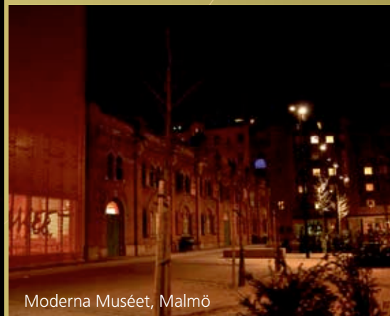
Moderna Muséet, Malmö