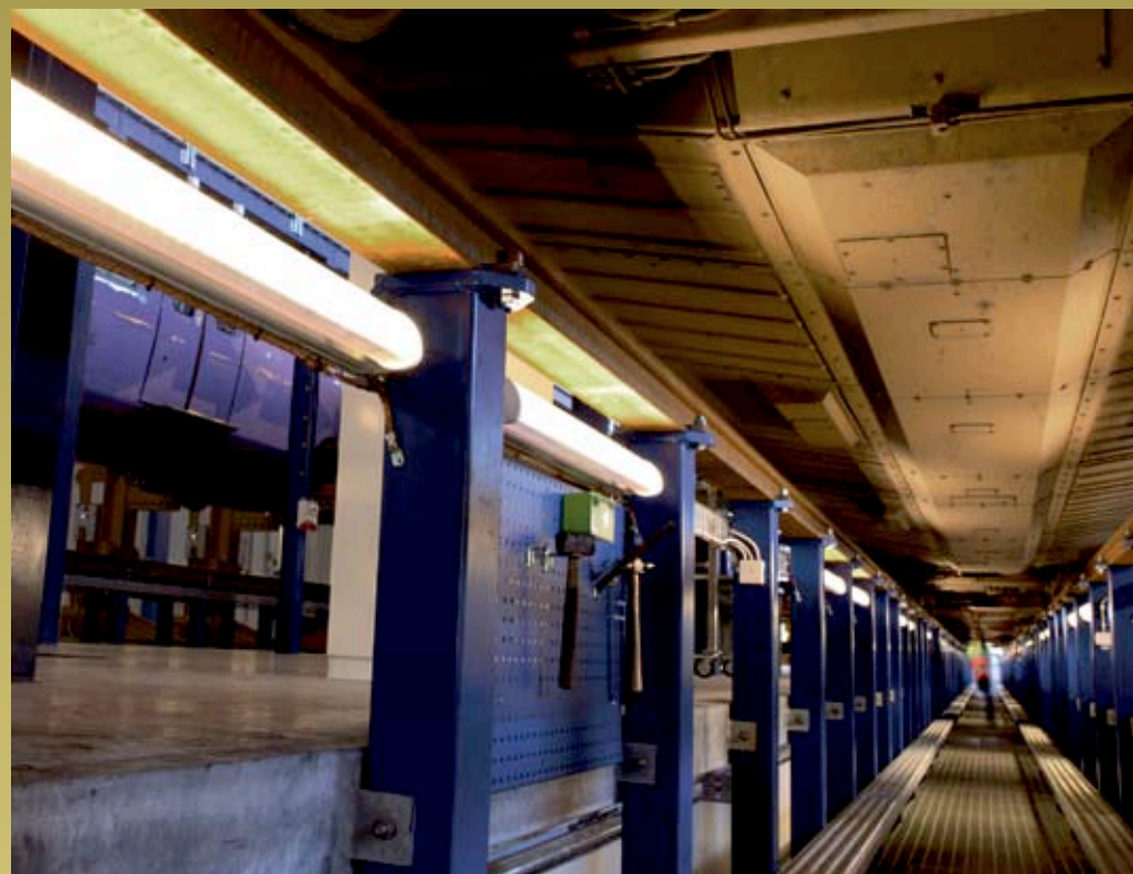
Raus bangård i Helsingborg Armaturnightspot Ljusdesign ÅF-Consult, Falun.