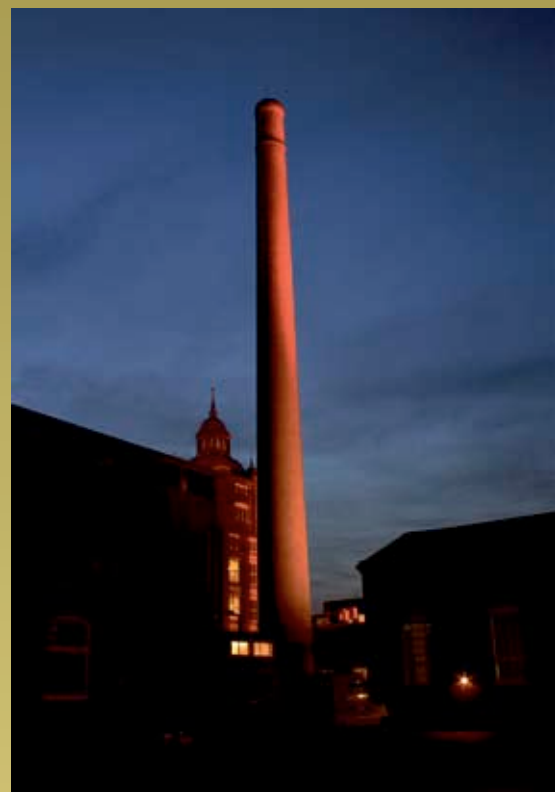
Skorsten Krokslätt Fabriker, Göteborg Armaturnightspot Ljusdesign Hampus Sjöström. WSP Ljusdesign, Göteborg.