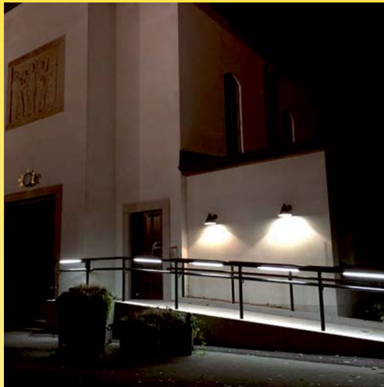
Skogskyrkogård Växjö. Armatur: Brightline Handledare. Ljusdesign: Göran Håkansson, Elprojekt Växjö.