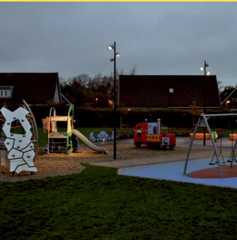
Lekplats Åkarp Burlöv. Armatur: Nightspot. Ljusdesign: Stefan Ohlin, Tyréns Malmö.