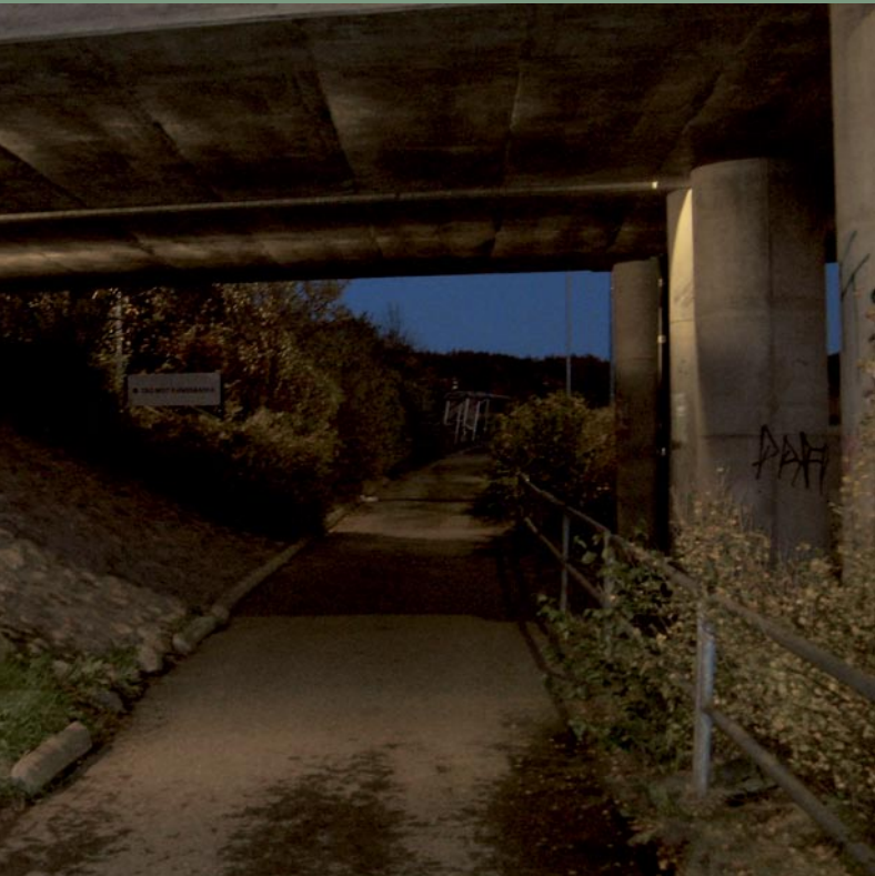
Under viadukt vid pendelstation Kungsbacka. Armatur: Superlight Compact. Ljusdesign: Jan-Erik Wallerstedt, Belpro Göteborg.