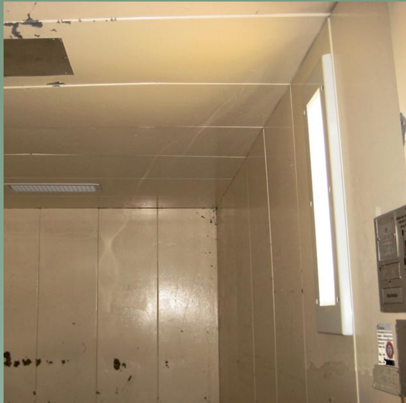
Sönderkörd hissbelysning ersatt med tåligare armatur. SCA Lilla Edet pappersbruk. Armatur: Nero, antivandalarmatur.