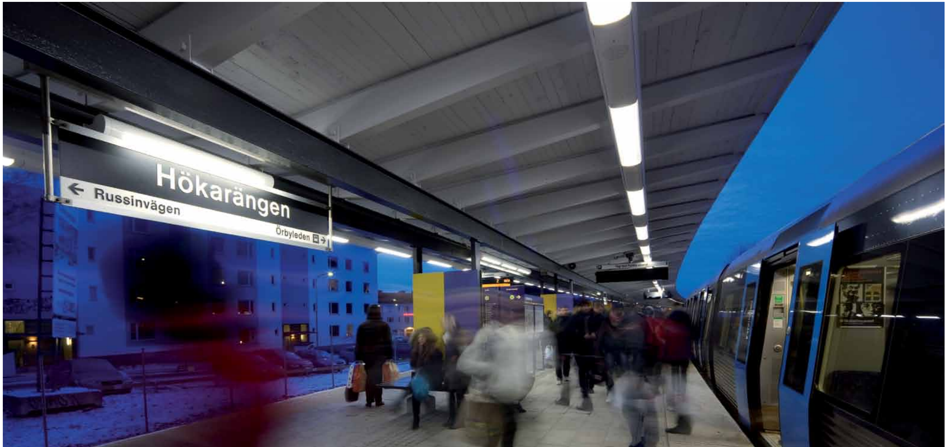
En 340 meter lång presentation av Profil 260 på Hökarängens station i Stockholm. Profilen följer perrongens kontur och rymmer samtidigt högtalare och belysning.