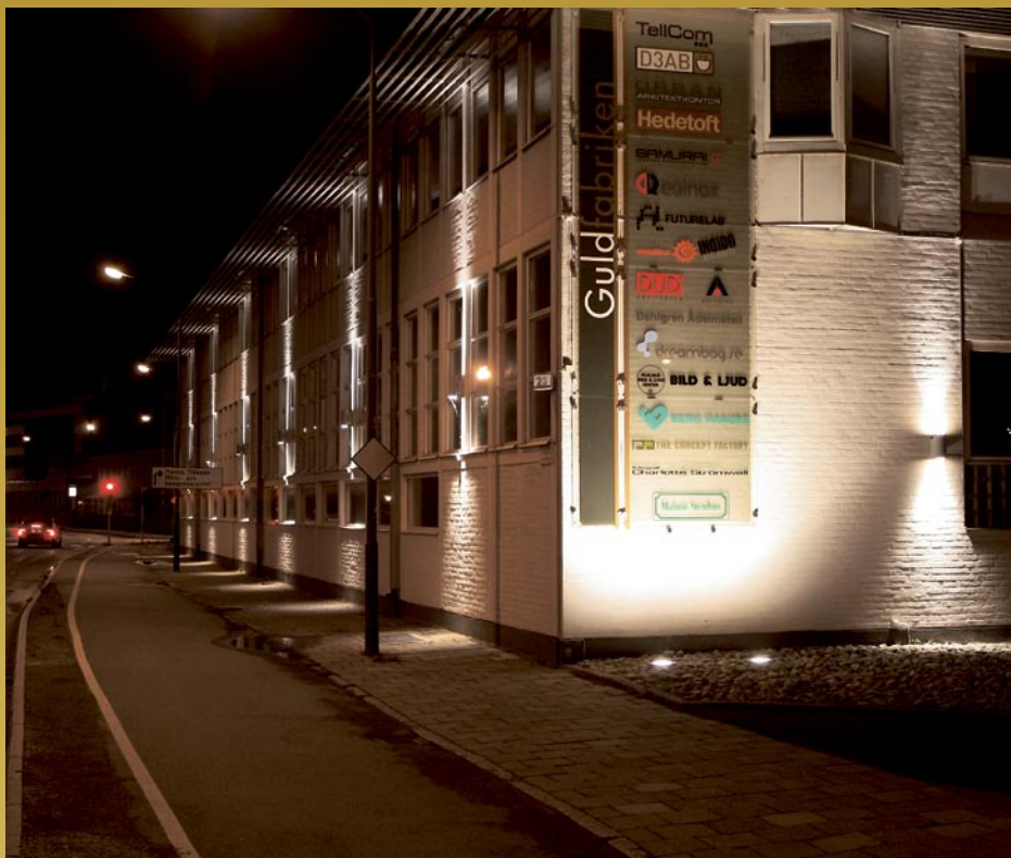
Gulfabriken, Malmö. Fasad- och trottoarbelysning. Armatyr: Twin EL, smalstrålande uppåt.