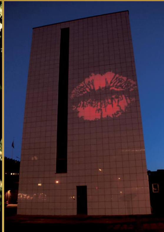
Love and Light ljusfest 2009, Gamla polishuset, Helsingborg. Armaturl: Nightspot Gobo. Ljusdesign och foto: Jan Ebbesson, JSAB Elkonsult Helsingborg.