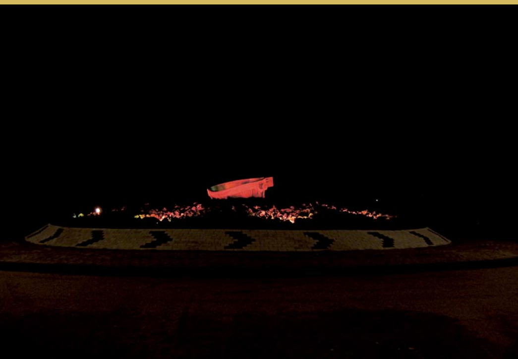
Alloys rondell, Vargön. Armaturl: Superlight Compact.