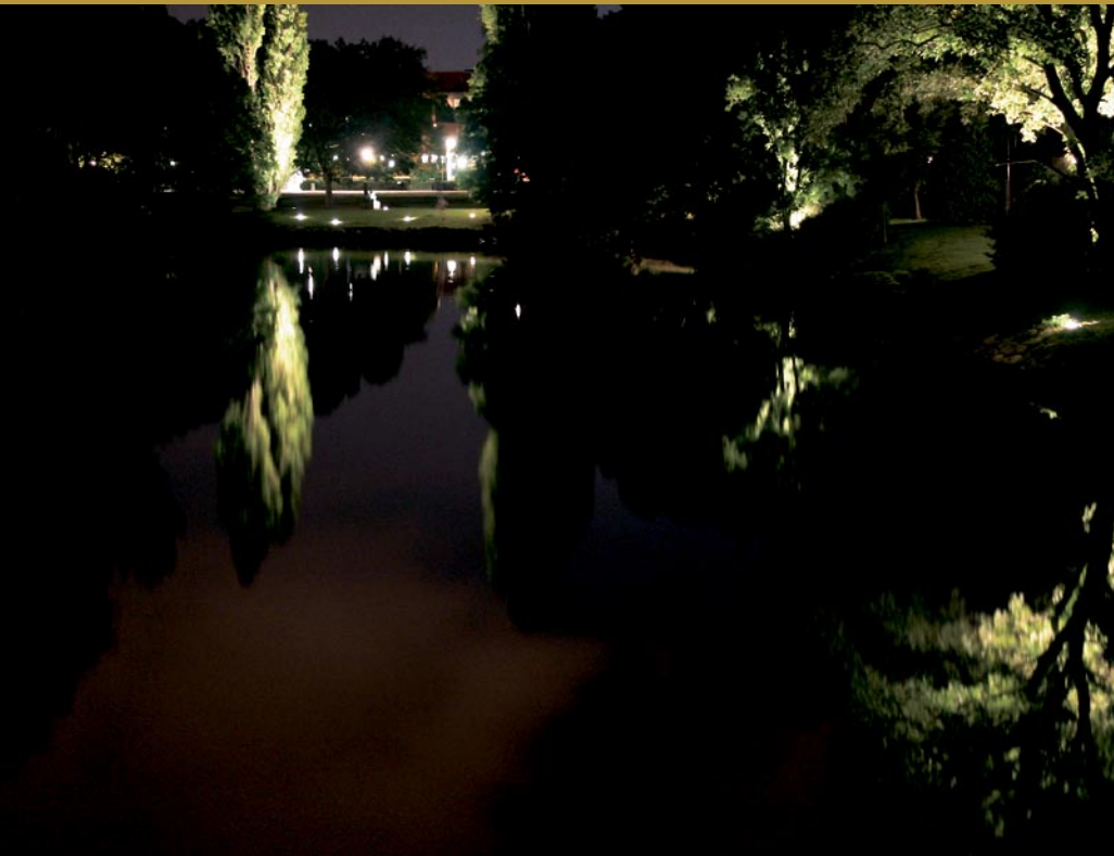
Kungsparken, Malmö. Armaturl: Markstrålkastare 35W. Ljusdesign: Bertil Göransson, Malmö stad.