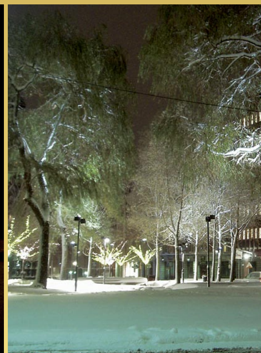
Gångväg- och trädbelysning, Brunkebergstorg, Stockholm. Armaturl: Superlight Compact. Ljussättning: Henrik Gidlund, Trafikkontoret, Stockholm.

Framsidan, första raden (fr v): Pendelstation Hökarängen. Armaturl: Takprofil med armatur Bränn. Hamm / BPS. (Konsult Electro Engineering AB, Stockholm. Foto Leif O Pehrson); Tunnelgatan, Brunkebergstunneln, Stockholm. Armaturl: Erfurt (Ljusdesign och beställare: Henrik Gidlund, Trafikkontoret Stockholm.); Odd Fellow Palatset, Malmö. Armaturl: Twin EL.